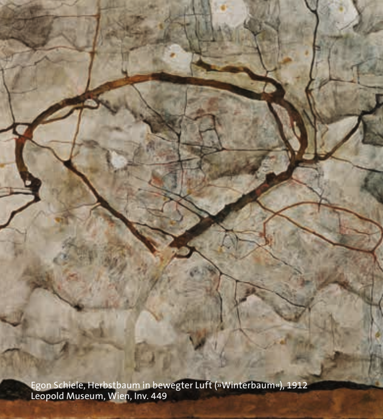
Egon Schiele, Herbstbaum in bewegter Luft (»Winterbaum«), 1912 Leopold Museum, Wien, Inv. 449