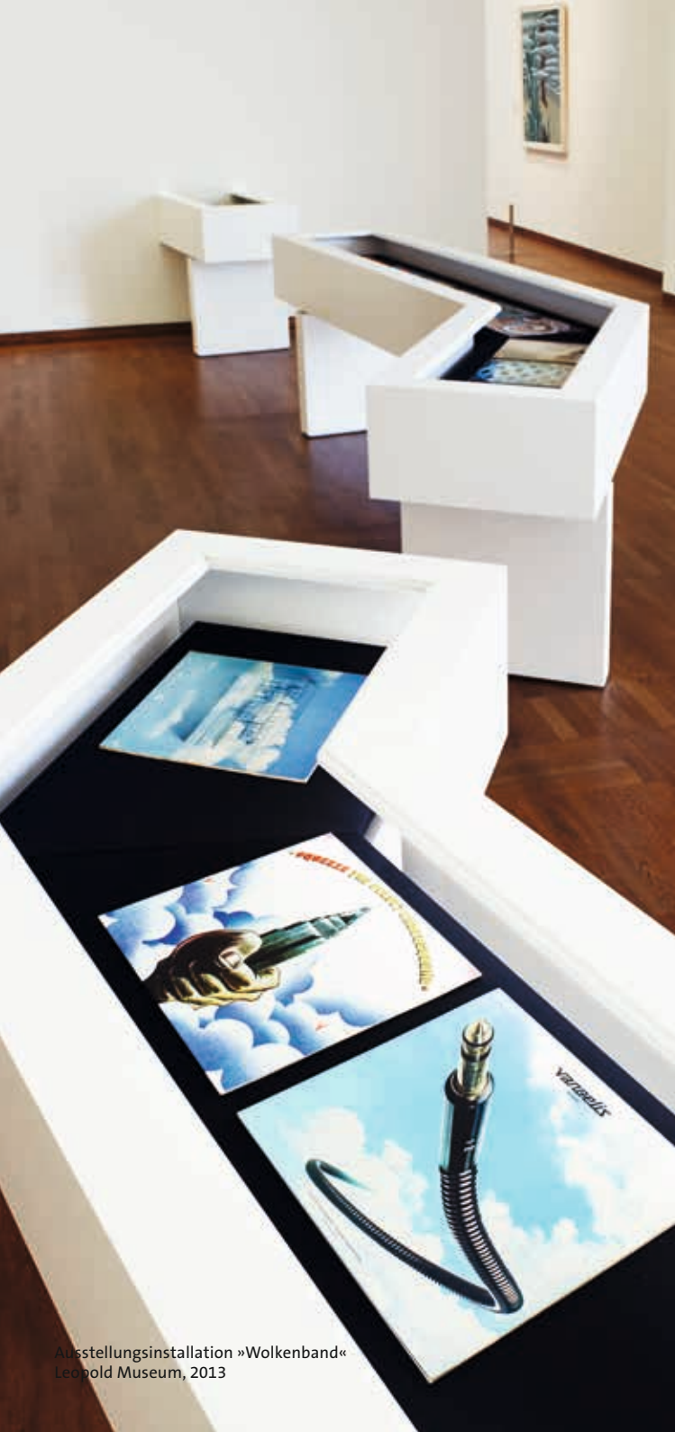
Ausstellungsinstallation »Wolkenband« Leopold Museum, 2013

Informationen zu den Schulvermittlungsprogrammen zur ständigen Sammlung unter: www.leopoldmuseum.org/de/fuehrungen