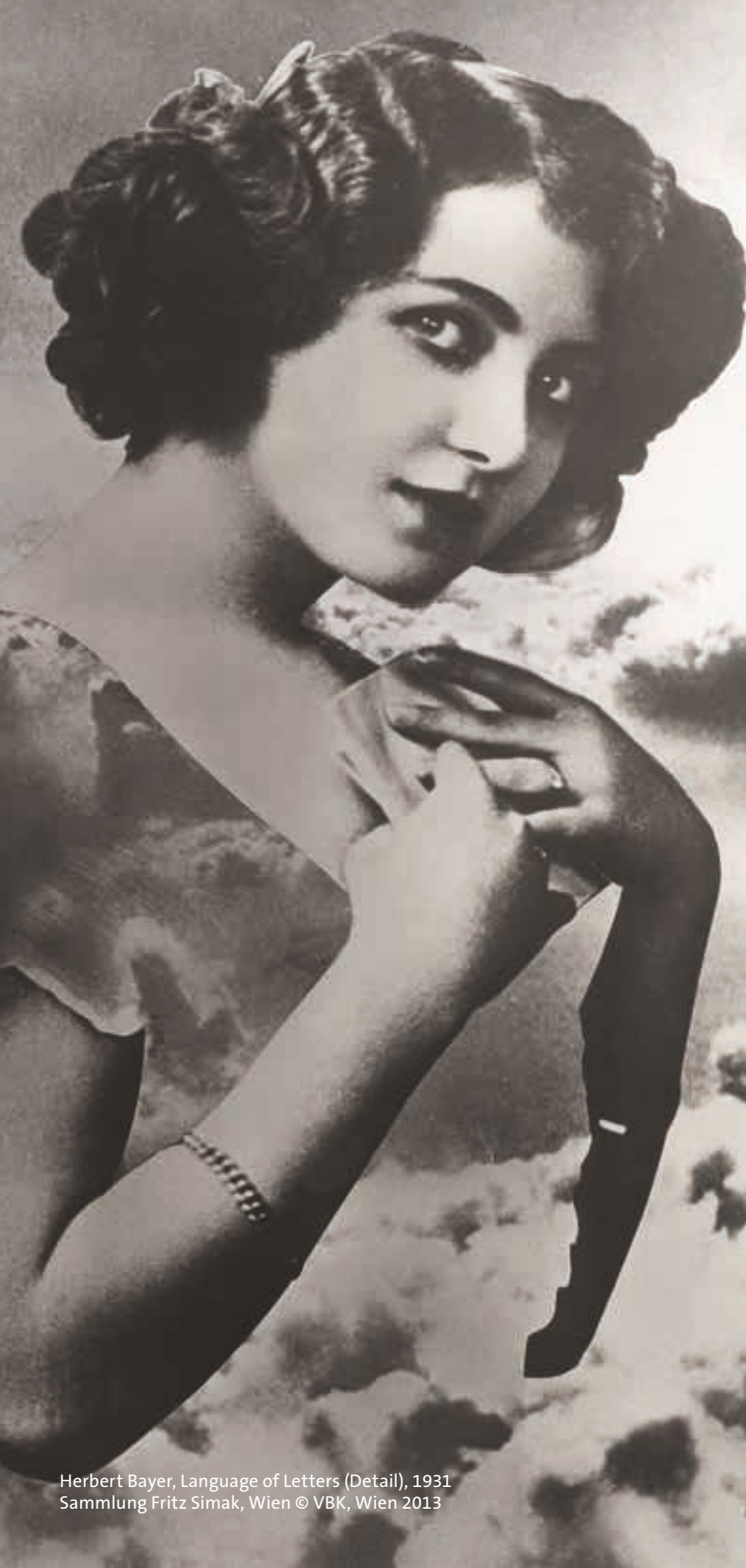
Herbert Bayer, Language of Letters (Detail), 1931