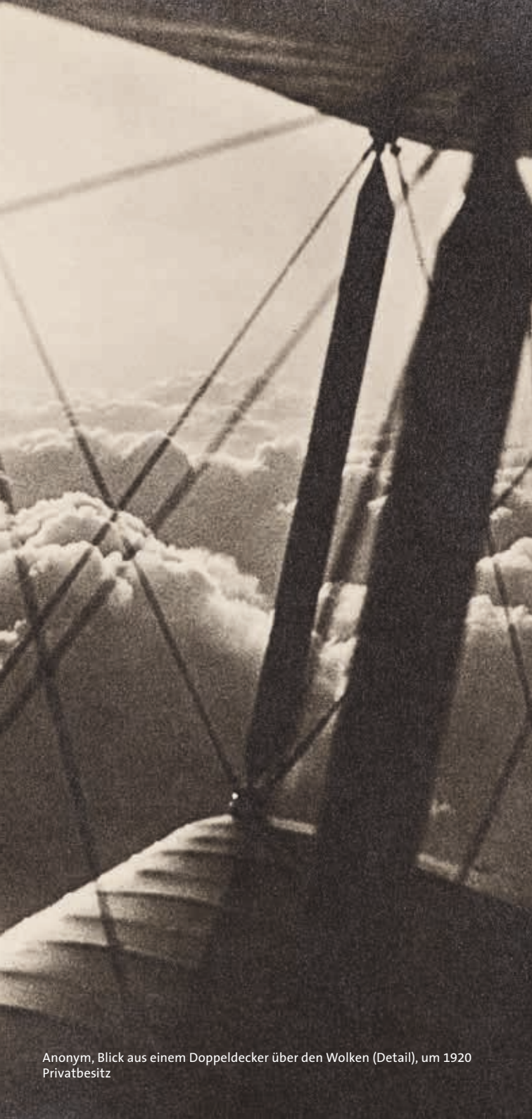
Anonym, Blick aus einem Doppeldecker über den Wolken (Detail), um 1920 Privatbesitz