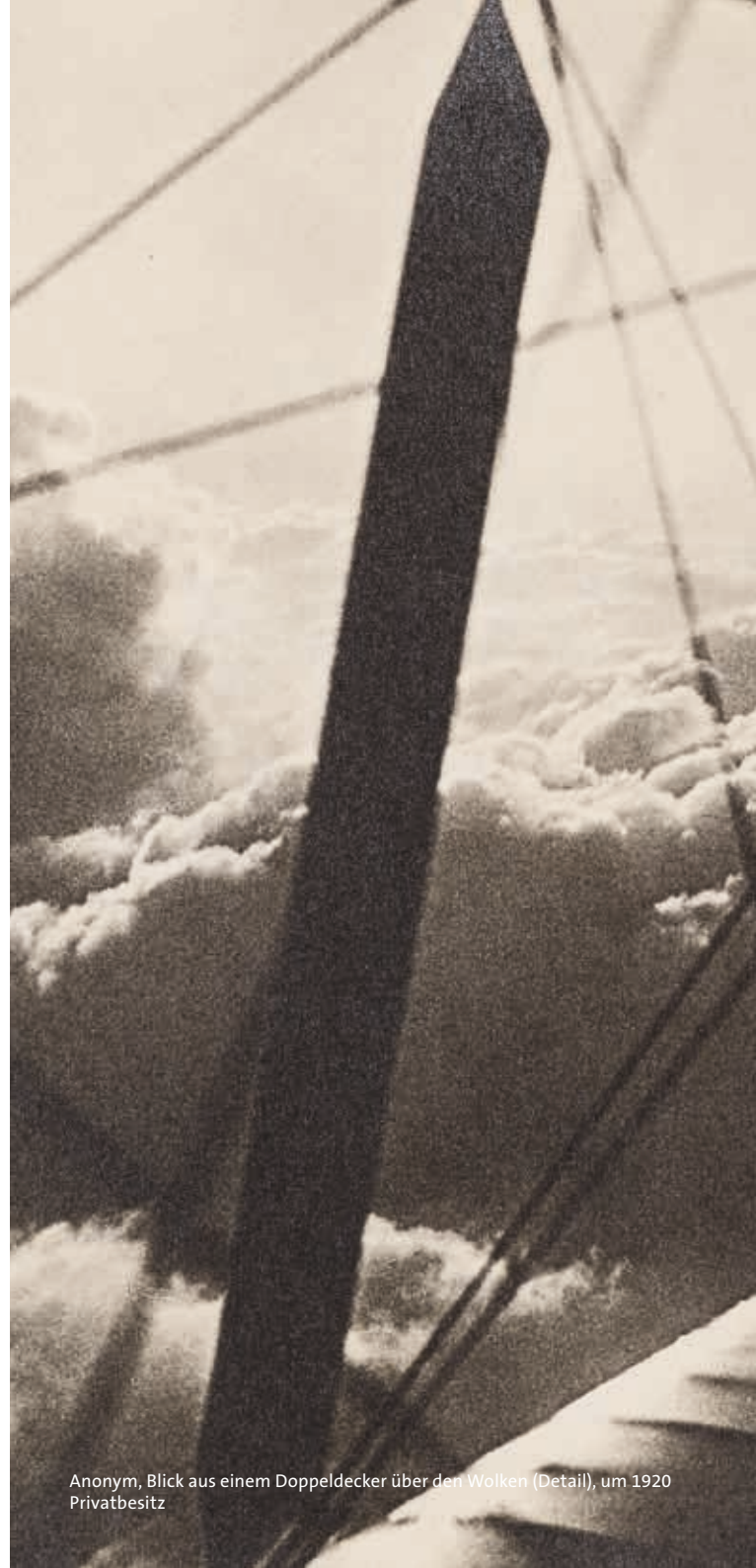
Anonym, Blick aus einem Doppeldecker über den Wolken (Detail), um 1920 Privatbesitz