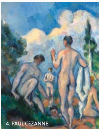
4. PAUL CÉZANNE

Wolken faszinieren – doch verblüffender Weise waren sie bislang kaum Thema einer eigenen Ausstellung. Nun zeigt das Leopold Museum erstmals eine umfassende Ausstellung von 1800 bis heute. Hochkarätige Leihgaben aus ganz Europa und den USA belegen in ungewöhnlicher Dichte Vielfalt und Wandel von Wolkendarstellungen. Die Schau spannt mit mehr als 300 Werken einen Bogen von der Romantik bis zur Gegenwart.