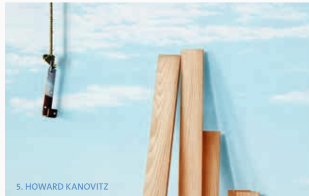
5. HOWARD KANOVITZ