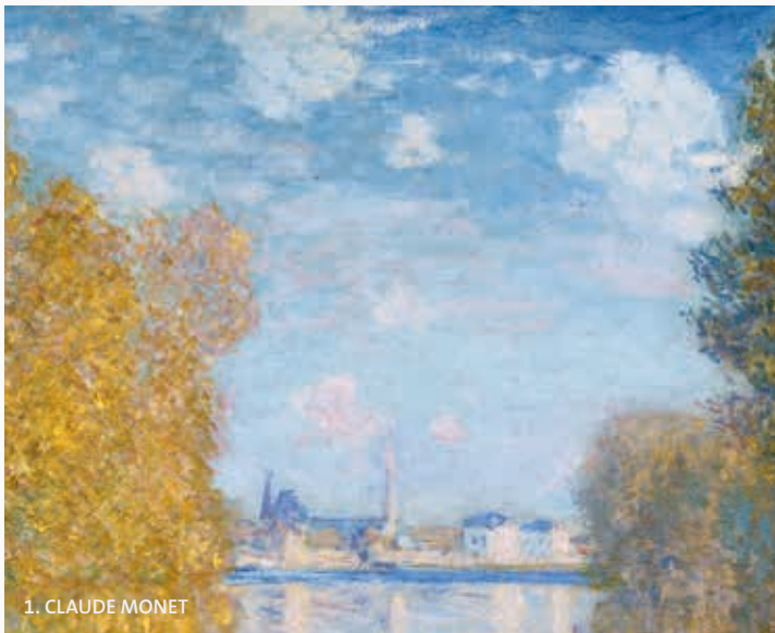
1. CLAUDE MONET