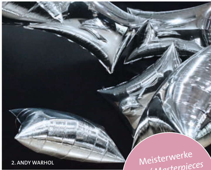
2. ANDY WARHOL